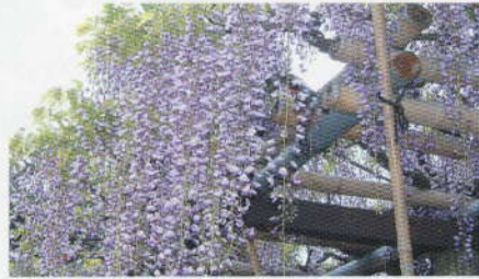
ぎょかん 御感の藤 見ごろ:4月下旬～5月上旬

桜の名所が城跡に多いのは、江戸時代、参勤交代の際に桜の苗木を持ち帰り、城に植えたことからだといわれています。小田原城天守閣やお堀などを背景に、約350本のソメイヨシノが春爛漫に咲き誇ります。夜にはライトアップも行われ、多くの観客が訪れます。日本のさくら名所100選