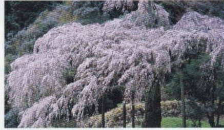
ちょうこうざんしょうじたいじ 長興山紹太寺のしだれ桜 見ごろ:3月下旬～4月上旬

江戸時代初期に藩主稲葉正則が植えたといわれ、樹齢は約340年、高さ約13メートル、株元周囲約4.7メートルの大木。満開のときは、花々が滝のように垂れ下がり、見事な姿を見せてくれます。 ●場所 長興山紹太寺 ●交通 箱根登山線入生田駅徒歩20分