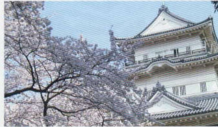
桜(桜まつり) 見ごろ:3月下旬～4月上旬

江戸時代初期に藩主稲葉正則が植えたといわれ、樹齢は約340年、高さ約13メートル、株元周囲約4.7メートルの大木。満開のときは、花々が滝のように垂れ下がり、見事な姿を見せてくれます。 ●場所 長興山紹太寺 ●交通 箱根登山線入生田駅徒歩20分