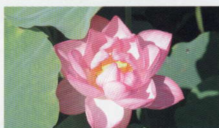
オオガハス 見ごろ:7月中旬～8月中旬

小田原城の東堀に約8,000株の花菖蒲と1,400株のあじさいが咲き誇ります。花菖蒲まつり期間中、夜はライトアップされ、昼間とはひと味違った幻想的な花を観賞できます。